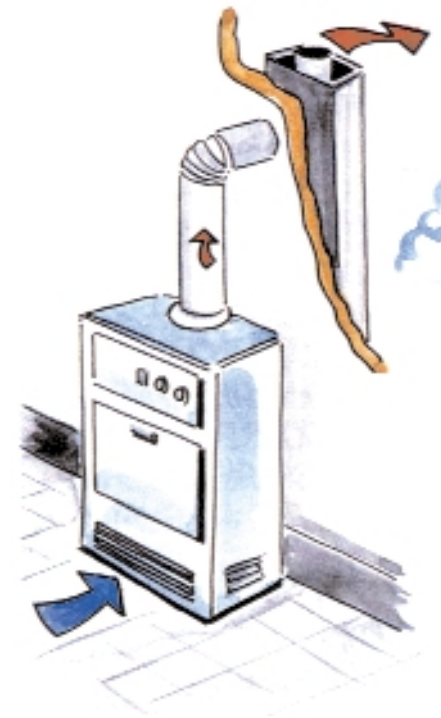
TIPO B BS

APPARECCHI (DIVERSI DALLE CUCINE), AVENTI FOCOLARE APERTO E COLLEGATI A UN CONDOTTO DI EVACUAZIONE DEI PRODOTTI DELLA COMBUSTIONE